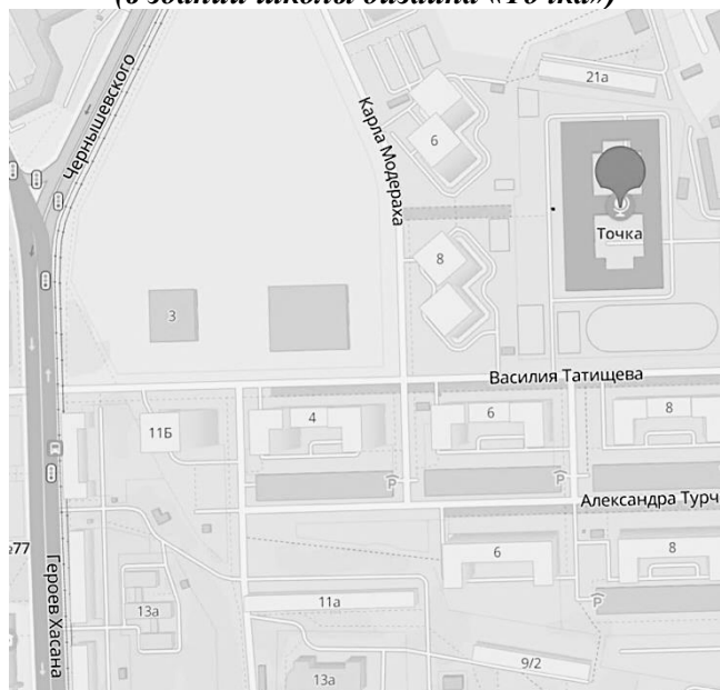
Схема пути в Академию первых, г. Пермь, ул. Василия Татищева, 7 (в здании школы дизайна «Точка»)

Ближайшие места общественного питания Столовая Академии первых расположена в этом же здании